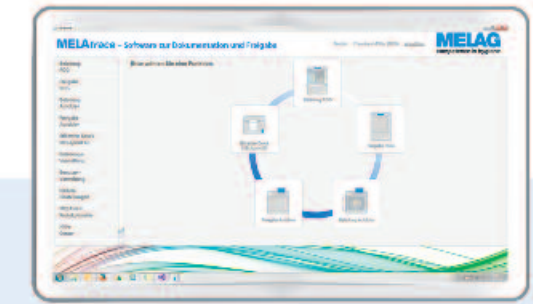
MELAtace® Die Freigabesoftware