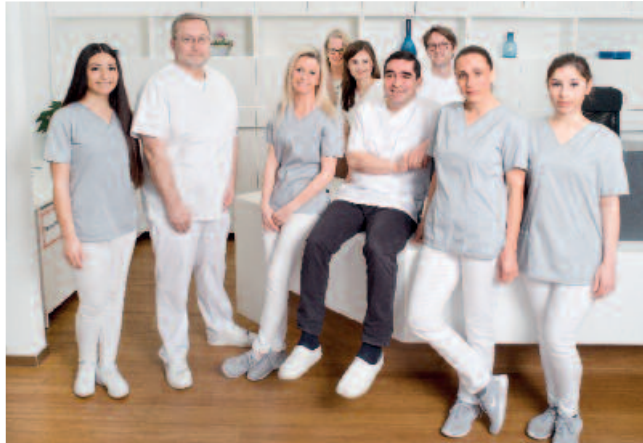
Dr. Bodem aus Heidelberg www.bodent-heidelberg.de

Der Systemgedanke wird auch Sie begeistern. Durch das vielseitige Zubehör kann der Aufbereitungsprozess auf alle Bedürfnisse einer Zahnarztpraxis zugeschnitten werden – unabhängig von Ihrer Praxisgröße und Ihrer Spezialisierung: