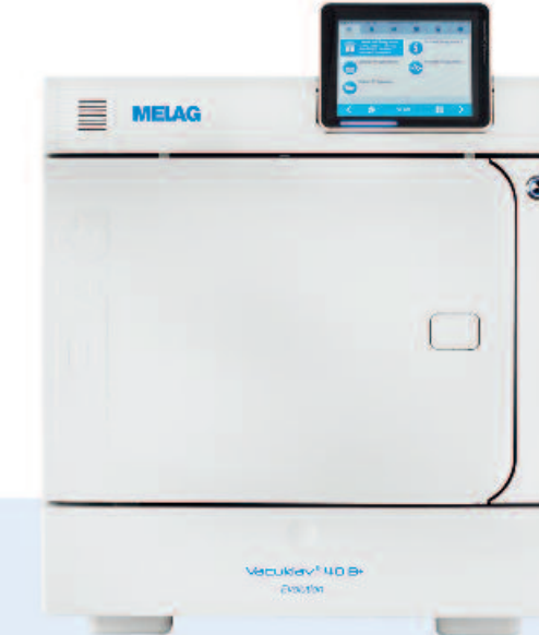
Vacuklav® 40 B+ Evolution Der Autoklav