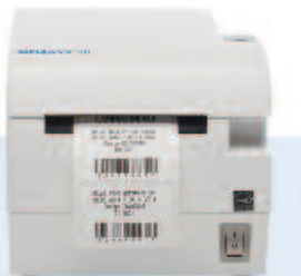
MELAprint® 60 Der Barcode-Drucker