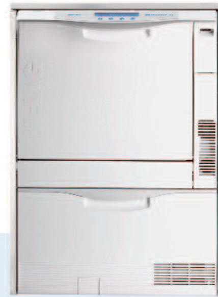
MELAtherm® 10 Der Thermodesinfektor

Die umgekehrte Beweislast erfordert den Nachweis einer lückenlosen und fehlerfreien Instrumentenaufbereitung. Die richtige Softwarelösung speichert Chargen- und Freigabeprotokolle ab und ermöglicht durch die Kennzeichnung der Instrumente eine Rückverfolgung.