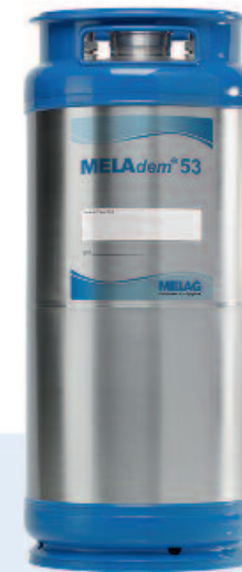
MELAdem® 53 Die Wasseraufbereitung